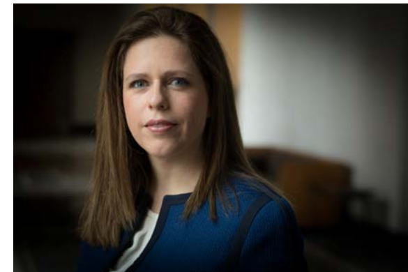
Carola Schouten ministra de Agricultura, Naturaleza y Calidad Alimentaria

El lema de este gabinete es «Confianza en el futuro». Tengo una gran confianza en que podamos trabajar hacia una agricultura circular y que, de la mano de agricultores, horticultores y pescadores, así como de otros empresarios y agentes interesados de la sociedad, seamos capaces de encontrar nuestro camino.